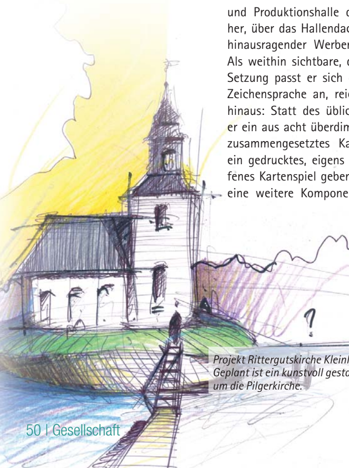
Projekt Rittergutskirche Kleinliebenau: Geplant ist ein kunstvoll gestalteter „grüner Sockel“ um die Pilgerkirche.

Gerade bei Kunstprojekten im öffentlichen Raum gilt es, sehr unterschiedliche Interessen- und Zielgruppengruppen an einen Tisch zu bringen, ohne dass sie sich gegenseitig blockieren. Diese Aufgabe übernehmen die Vermittler bzw. Mediatoren. In Deutschland sind es derzeit sechs. Diese Kuratoren begleiten den künstlerischen Prozess von der Entwicklung eines Anforderungsprofils, über die Auswahl der Künstler und die Begleitung der Konzeptionsphase bis zum endgültigen Entwurfes bis hin zur Beschaffung von Geldern und Begleitung der Realisierung. In Frankreich hat sich dieses Konzept hundertfach bewährt. In seinem New-Patrons-Manifest schreibt François Hers dazu: „Alle Beteiligten stimmen einer gleichberechtigten Verteilung der Verantwortlichkeiten zu und erklären sich einverstanden, die Spannungen und Konflikte, die das öffentliche Leben in einer Demokratie mit sich bringt, auf dem Verhandlungsweg zu lösen. Ebenso wird das Kunstprojekt nicht zum emblematischen Ausdruck eines einzelnen Individuums, sondern mehrerer unabhängiger Personen, die entschlossen sind, als Gesellschaft aufzutreten und dem zeitgenössischen Projekt einen gemeinsamen Sinn zu geben.“ Und dieser gemeinsame Sinn schafft letztendlich eine hohe Akzeptanz des Kunstobjektes in der Zivilgesellschaft. D.T.