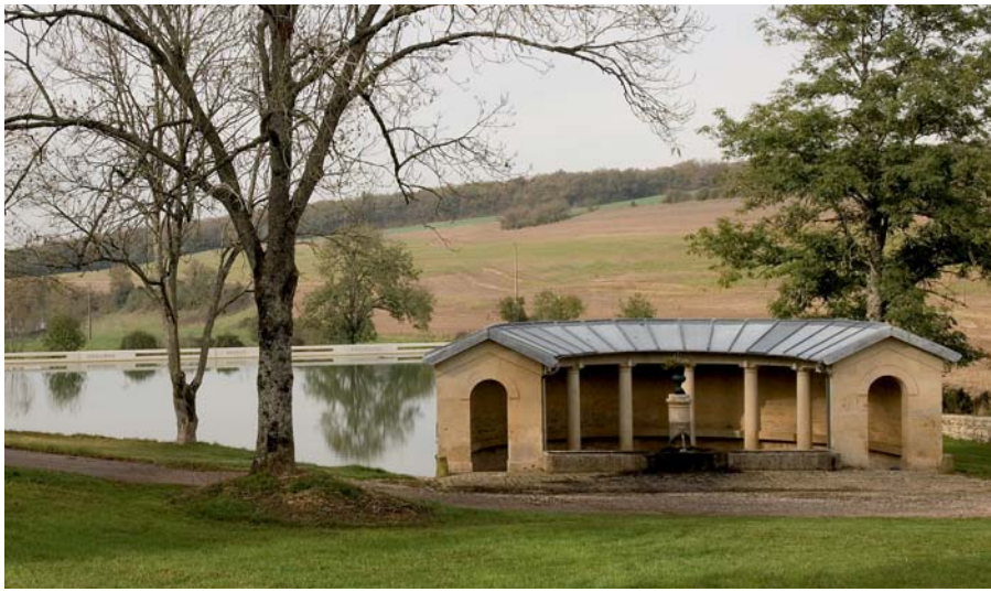
Waschhaus von Blessey, Burgund, 1997–2007. Im Zuge der Renovierung des Waschplatzes, der in Form eines Halbkreises angelegt ist, wollten die Bürger der 25-Seelen-Gemeinde Blessey den Ort im Rahmen einer gemeinsamen Aktion mit mehreren Dörfern der Region durch einen Künstler aufwerten lassen. Der Künstler Rémy Zaugg rückte das Waschhaus in Zusammenarbeit mit den Bürgern durch eine neue Wegeführung, die Anlage eines Teiches und einer Mauer ins Zentrum der Wahrnehmung.